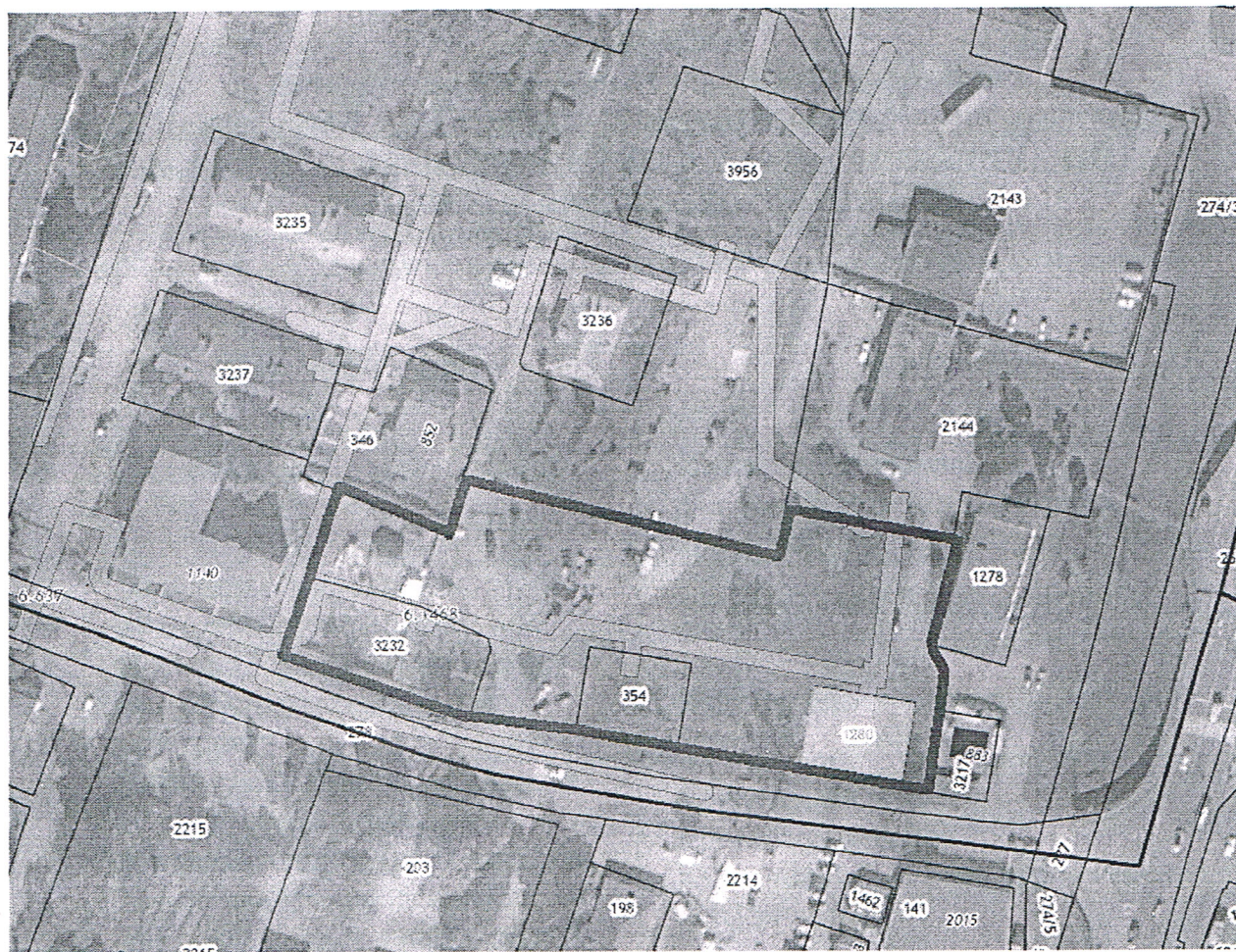
Схема границ территории планирования