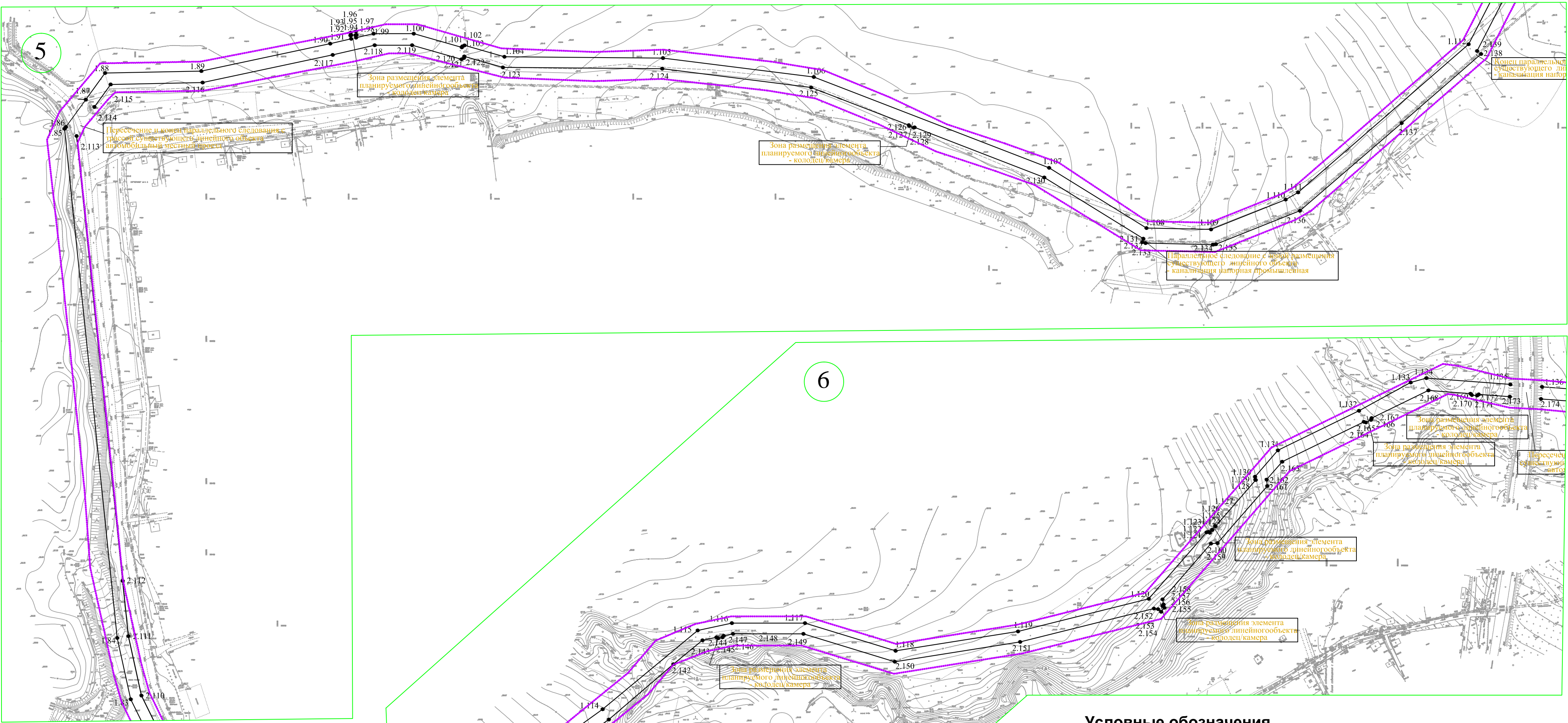
Схема выносок из чертежа