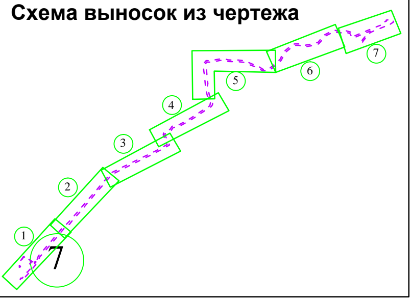
Схема выносок из чертежа