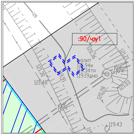
Выноски с отображением контуров границ сервитута