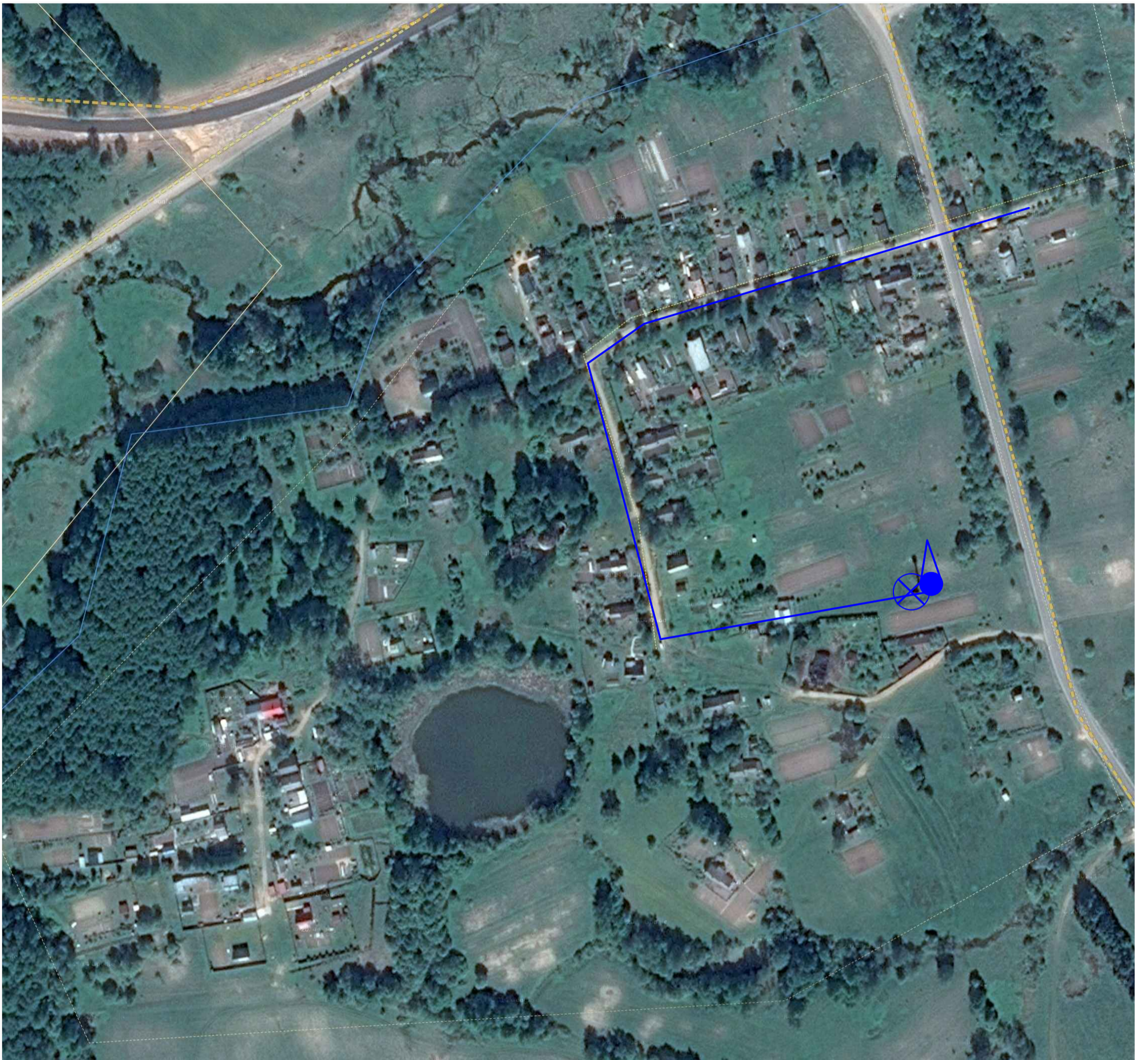
СХЕМА ВОДОСНАБЖЕНИЯ с. МИХАЙЛОВСКОЕ