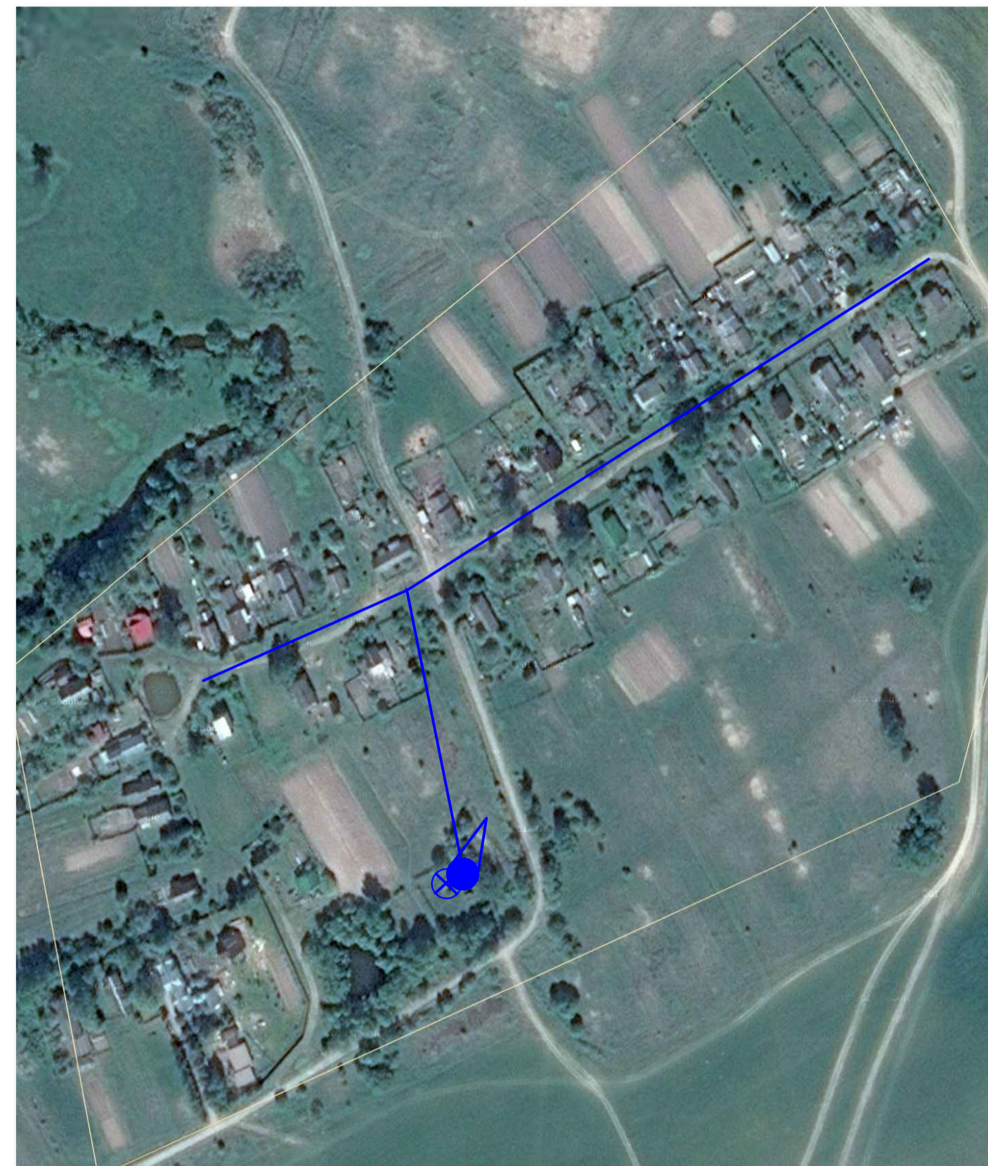
СХЕМА ВОДОСНАБЖЕНИЯ д. ЛАПТЕВО